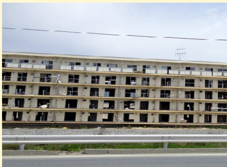
↑ 岩手県陸前高田市の集合住宅だったところ。 津波で4階部分まで水につかった跡が残っています。

「ボランティアに行ってみないとわからないことが山ほどあった」という今回のボランティア。被災地の現状をお互いに知り、「復興のために何ができるのか？」を一緒に考えましょう。