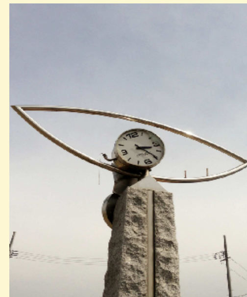
↑ 岩手県大船渡市の時計。 津波がきた時刻で時計が止まっています。